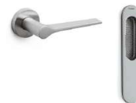
Olivari fittings LAMA model Satin-finish chrome Herrajes Olivari Modelo LAMA Cromo satinado