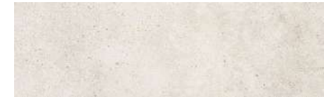
Master & Second bathroom Rectified porcelain tiles Vela Natural Porcelanosa 31,6 x 90 cm