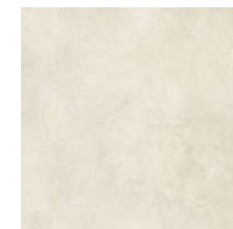
Exterior Gres porcelánico Vela Natural C3 100x100cm