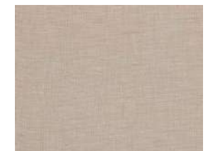
Textil Cactus textile Textil Cactus textile