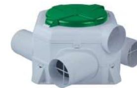
Mechanical ventilation system Sistema de ventilación mecánica