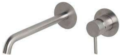
Concealed shower deck shower system.