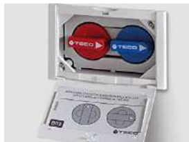
Shut-off valve. Hidden control. Llave de corte mando oculto

Two concealed shut-off valves for hot and cold water in each wet room.