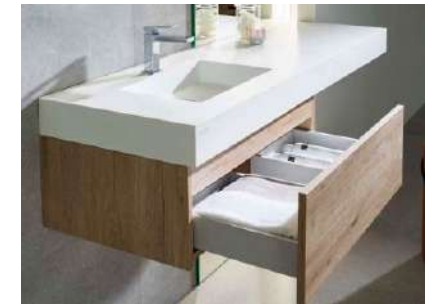
ONE KOLE hanging unit