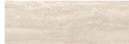
Master Decorative tiles Roma Marfil Porcelanosa 59,6x120cm