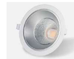
Downlight led CELER