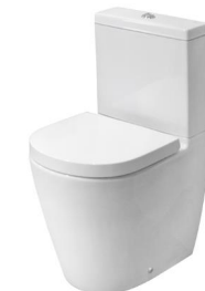
Acro Compact toilet Inodoro Acro Compact