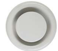
Extractor duct Boca de extracción