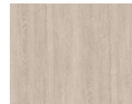
Doors Smoked Oak Puertas Roble humo