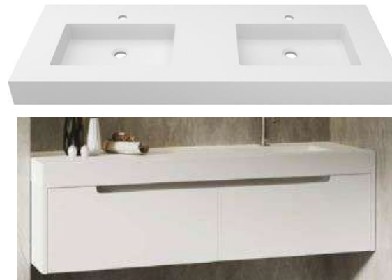
ONE hanging KOLE unit Encimera KOLE Mueble ONE suspendido