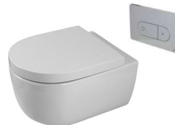
Acro Compact suspended toilet Inodoro suspendido Acro Compact