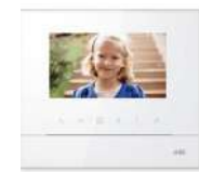
Videoportero Video intercom