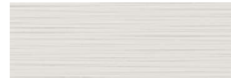
Second bathroom Decorative Limit Vela Natural Porcelanosa 33,3 x 100 cm