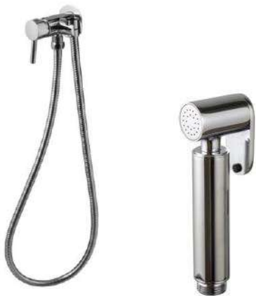
Round stainless steel single tap shower set

Monomando set ducheta sanitaria Round inox