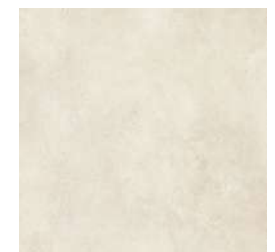
Interior Gres porcelánico Vela Natural 100x100cm