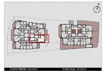
PLANTA PRIMERA - BLOQUE 1