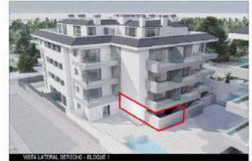
NOTA LATERAL DERECHO - BLOQUE 1