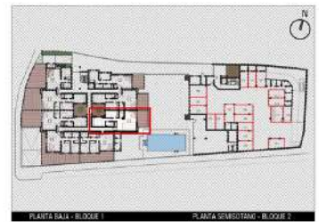
PLANTA BAJA - BLOQUE 1