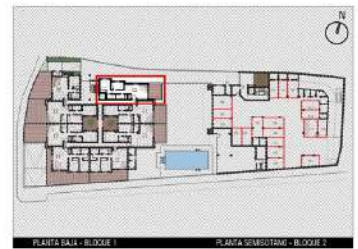
PLANTA BAJA - BLOQUE 1