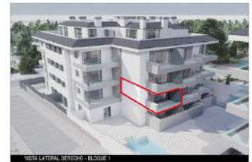
NOTA LATERAL BLOQUE 1 - BLOQUE 1