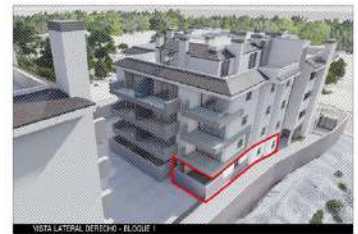
VISTA LATERAL BLOQUE - BLOQUE 1